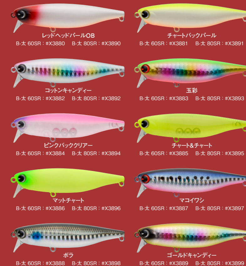
レッドヘッドパールOB B-太 60SR: #X3880 B-太 80SR: #X3890 チャートバックパール B-太 60SR: #X3881 B-太 80SR: #X3891 コットンキャンディー B-太 60SR: #X3882 B-太 80SR: #X3892 玉彩 B-太 60SR: #X3883 B-太 80SR: #X3893 ピンクバッククリアー B-太 60SR: #X3884 B-太 80SR: #X3894 チャート&チャート B-太 60SR: #X3885 B-太 80SR: #X3895 マットチャート B-太 60SR: #X3886 B-太 80SR: #X3896 マコイワシ B-太 60SR: #X3887 B-太 80SR: #X3897 ボラ B-太 60SR: #X3888 B-太 80SR: #X3898 ゴールドキャンディー B-太 60SR: #X3889 B-太 80SR: #X3899